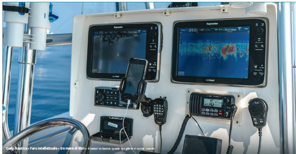
Daily Nautica • Faro intellettuale • Un mare di libri • Il radar in barca: quale scegliere e come usarlo